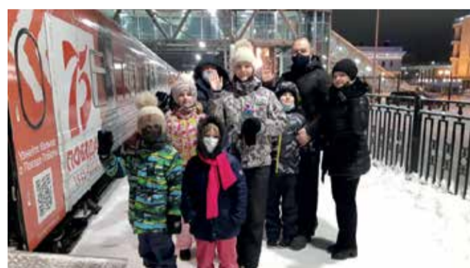
Поезд Победы в Петрозаводске