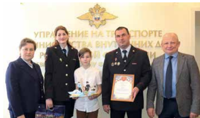
Акция «Полицейский Дядя Степа»