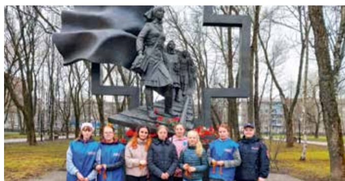
Акция «Георгиевская ленточка» Вологодского ЛО России на транспорте