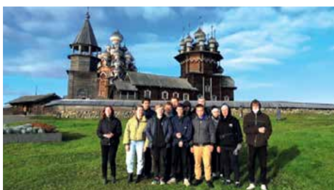
Экологическая программа в музее-заповеднике «Кижі»