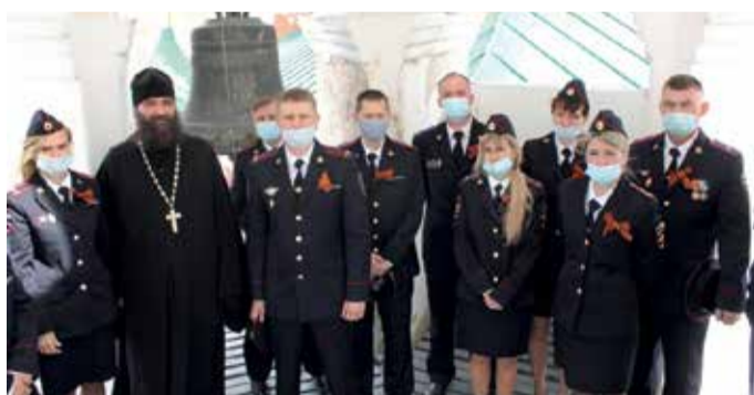
Визит сотрудников Северного ЛО МВД России на транспорте в гарнизонный Храм Архангела Михаила г. Ярославля