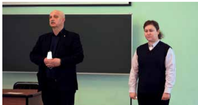
Кураторский час с транспортной полицией