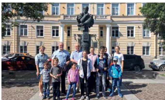
Экскурсия в ПГУПС императора Александра I