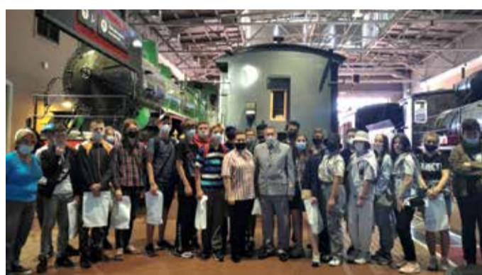
Экскурсия в Музей железных дорог России