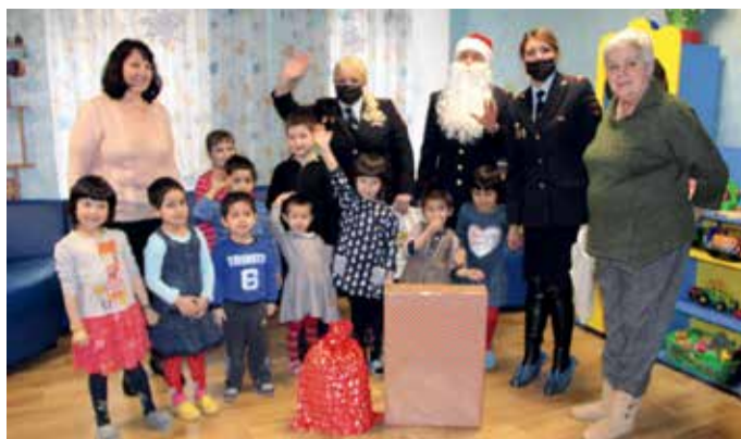
Визит в социальный приют для детей «Транзит»