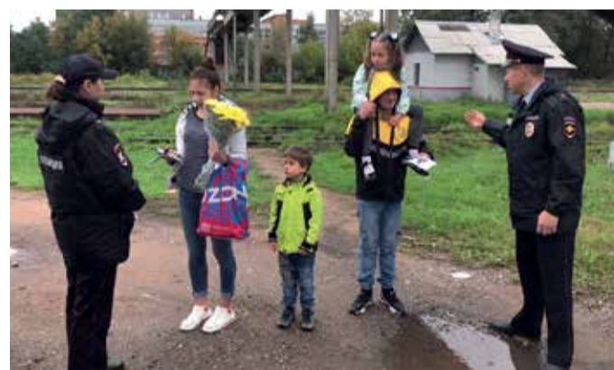
Акция «Безопасный путь» Псковского ЛО МВД России на транспорте