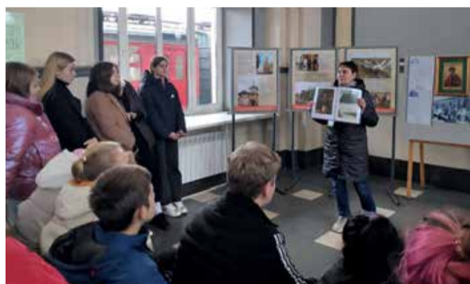
Экскурсия на железнодорожном вокзале станции Бологое-Московское