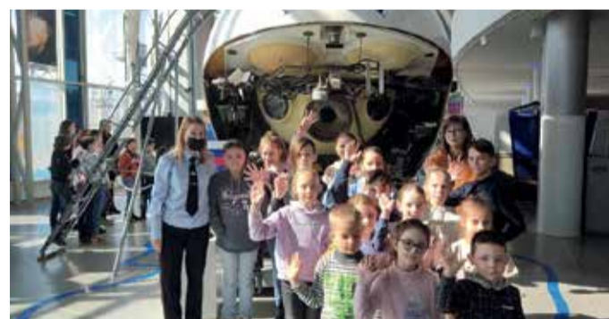
Акция «Знакомство с подводным миром» г. Калининград