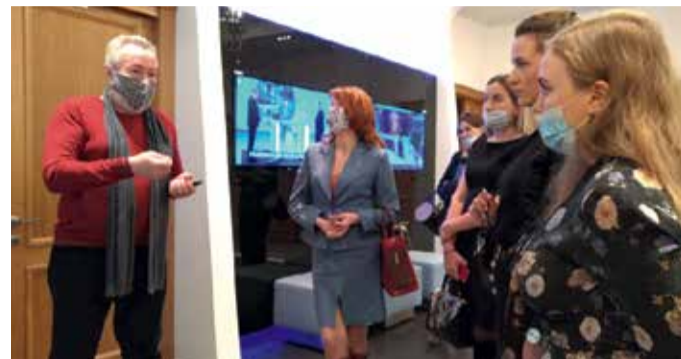
Семинар в информационном агентстве Северо-Запад-ТАСС