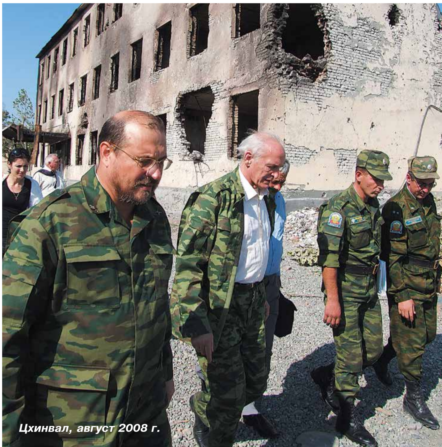
Цхинвал, август 2008 г.

Советскому и российскому актеру театра и кино, мастеру художественного слова Лауреату Ленинской премии Народному артисту СССР ЛАНОВОМУ Василию Семеновичу – 85!